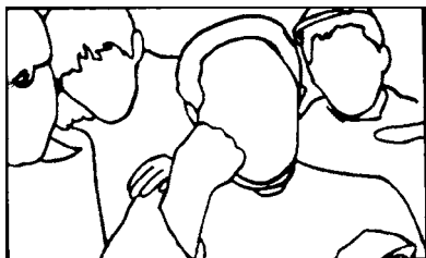
MOVIMIENTO DE EDUCADORES MILANIANOS

la "Carta a una maestra" de la escuela de Barbiana (Italia) y su maestro Lorenzo Milani.