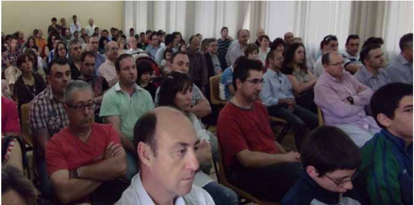
Celebración de aniversarios en Salamanca: 14M de 2011