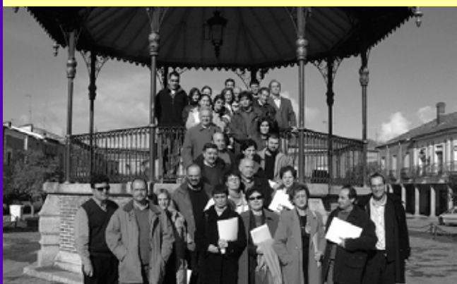
Asamblea del MEM en Peñaranda de Bracamonte 2002.

Yo no me podía perder la fiesta de la Granja escuela “Lorenzo Milani” este 14 de Mayo. Colgué la invitación en lugar visible para tenerla presente, a la vez que se agolpaban en mi mente multitud de recuerdos de tantos años. No me podía creer que ya hubieran