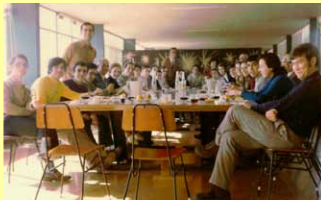
Es la foto más antigua del parto de casa-escuela: una comunidad de base en Salamanca 1970.