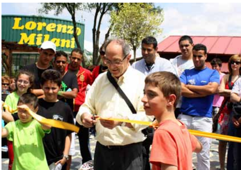
Celebración del 30 aniversario de la Granja-escuela.